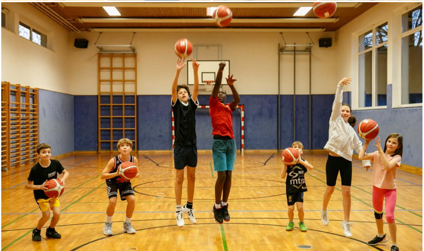
Begeisterte Kinder beim Basketballtraining