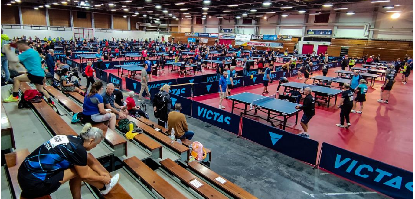
Ein Blick über die volle Messehalle

Im September nahmen vier Spieler aus unserer Gruppe bei der PingPongParkinson Weltmeisterschaft in Wels teil. Es ist schon ein faszinierender Anblick, die mit 48 TT-Tischen bestückte Messehalle in Wels zu sehen und das alles übertönende „Ping-Pong“, gleich einem Taktgeber, zu hören. An die 300 Teilnehmer aus 23 Nationen waren am Start, sie alle folgten dem Rhythmus der Tischtennisbälle.