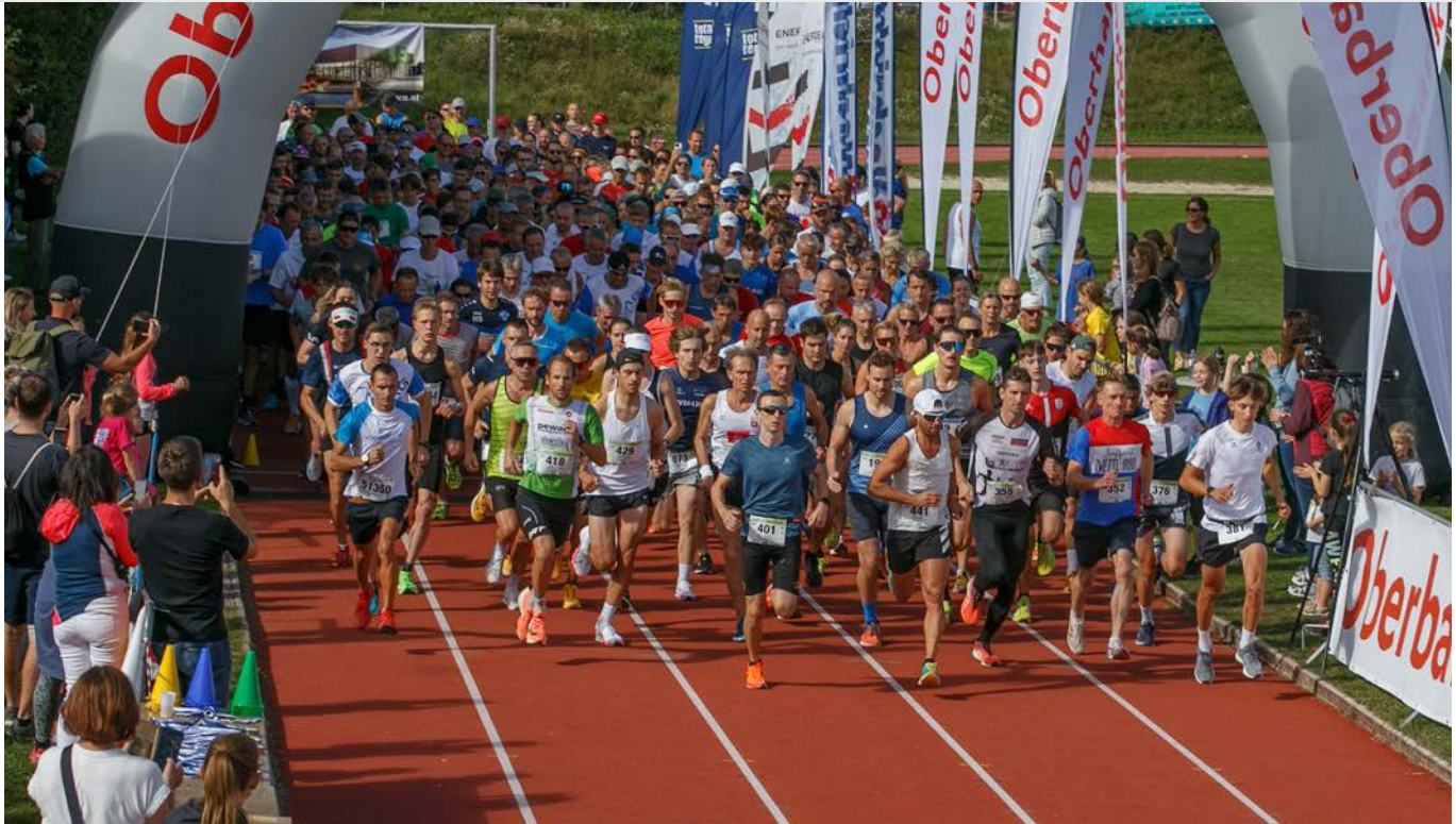
Massenstart OBERBANK DONAULAUF 2023