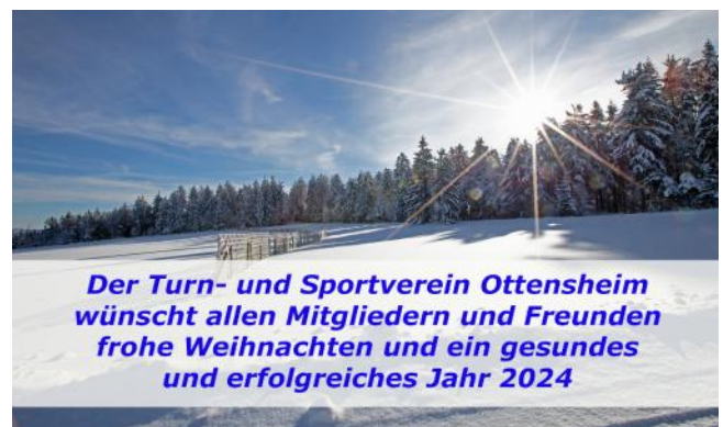
Präsident Bernhard Steiner